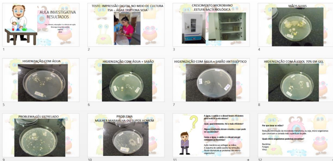
Figura 2 – Demonstración de los resultados de la clase investigadora y preguntas orientadoras para la discusión y elaboración de las conclusiones.

Además, los estudios muestran que, en las actividades lúdicas, los adolescentes si sienten en un clima más relajado y libre para expresar sus opiniones, lo que facilita la reflexión sobre los asuntos abordados y el respeto con relación a la opinión de los colegas (MONTEIRO; VARGAS; REBELLO, 2003; YONEKURA; SOARES, 2010).