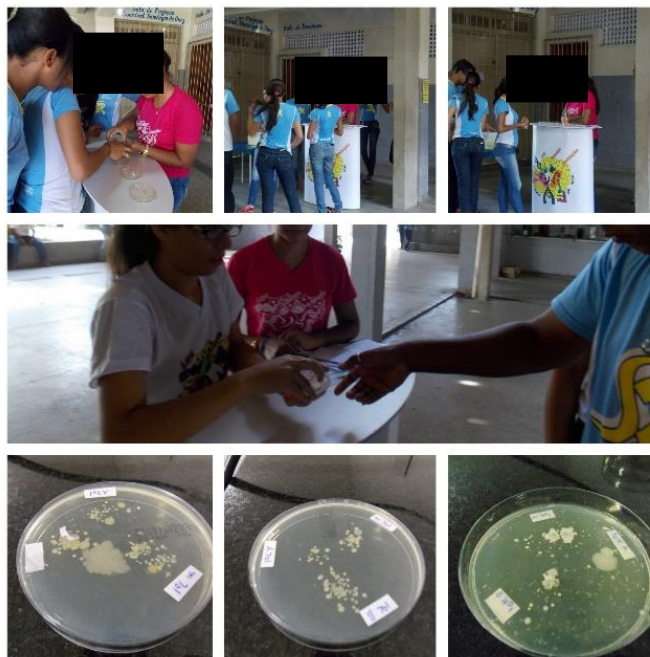
Figura 1 – Atividade experimental de la clase investigadora sobre la higienización de las manos