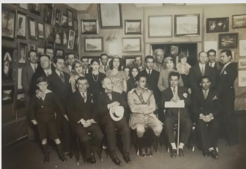
Figura 2. Artistas expositores da IX Exposição Geral de Belas Artes de Minas Gerais, 1933. Fotografia.

Em alguns registros fotográficos do ano de 1933, podemos visualizar como eram organizadas as obras nas Exposições Gerais (Figuras 2, 3 e 4). A organização é bastante similar às exposições que Aníbal Mattos organizava à frente do Centro Artístico Juventas 51 (Figuras 5 e 6), no Rio de Janeiro: diversos trabalhos emoldurados, pendurados em pequenas paredes, com relativa proximidade uns sobre os outros e uns ao lado dos outros.