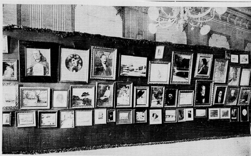
Figura 6. III Exposição do Centro Artístico Juventas, realizada no Rio de Janeiro.