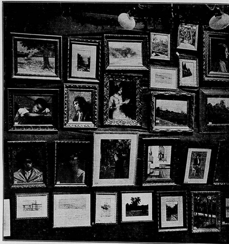
Figura 5. III Exposição do Centro Artístico Juventas, realizada no Rio de Janeiro.

Horizonte (Figura 4), similares à forma com que eram organizadas as obras nas exposições também organizadas por Aníbal Mattos no Rio de Janeiro, à exemplo da III Exposição do Centro Artístico Juventas (Figuras 5 e 6).