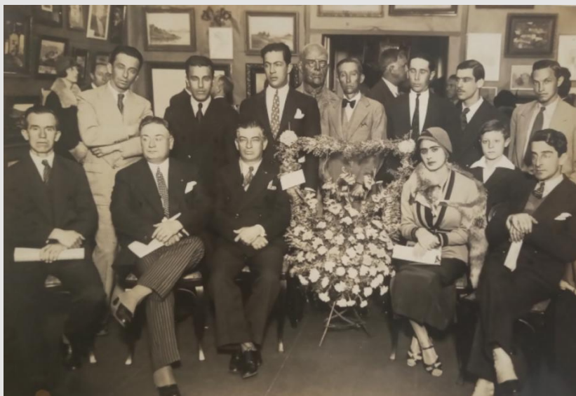
Figura 3. Artistas expositores em uma das edições da Exposição Geral de Belas Artes de Minas Gerais. Fotografia enviada por Gustavo Capanema a Renato Augusto de Lima.