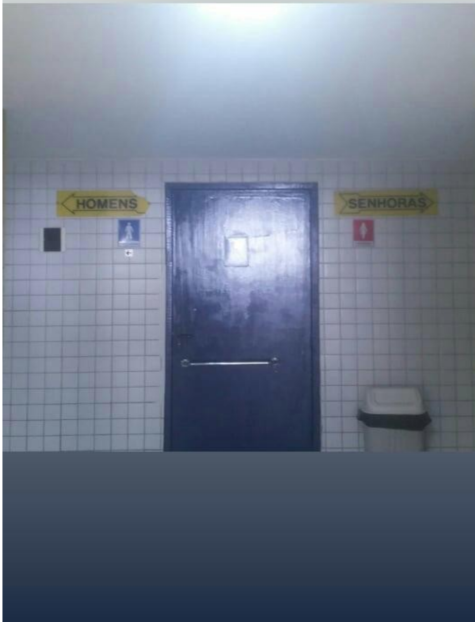
Fig. 4 – Banheiros no Terminal Rodoviário da cidade de Caruaru (PE),

ANDRADE, Luana; NUNES, Luciana Borre. Iniciativa privada: Banheiros em projeção. PÓS:Revista do Programa de Pós-graduação em Artes da EBA/UFMG. v.10, n.19: mai.2020 Disponível em < https://eba.ufmg.br/revistapos >