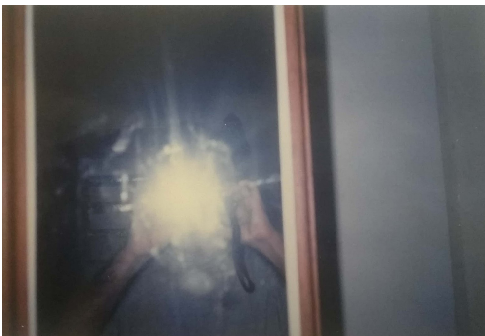
Fig. 2 – Meu pai experimenta o flash da câmera analógica no espelho.

Tudo o que não dorme, trabalha e vigia. A proposta da Iniciativa Privada é empenhar-se em tornar visível a brecha pela qual é possível observar as zonas de indiscernibilidade, lançando, literalmente, uma luz em processos de subjetivação que neutralizam a intensidade de um fluxo insurgente de questionamentos. Essa luz não tem, como pode parecer, uma atribuição de Verdade, mas de uma claridade que, de tão violenta, encandeia a vista. Fabrica outra espécie de dúvidas e de anonimatos: o que somos capazes de ver e de dizer, circunstancialmente suspensos das polícias e dispositivos de vigilância? Somos capazes de subverter os dispositivos para acessar a nossa humanidade, ainda que bárbara e promíscua?