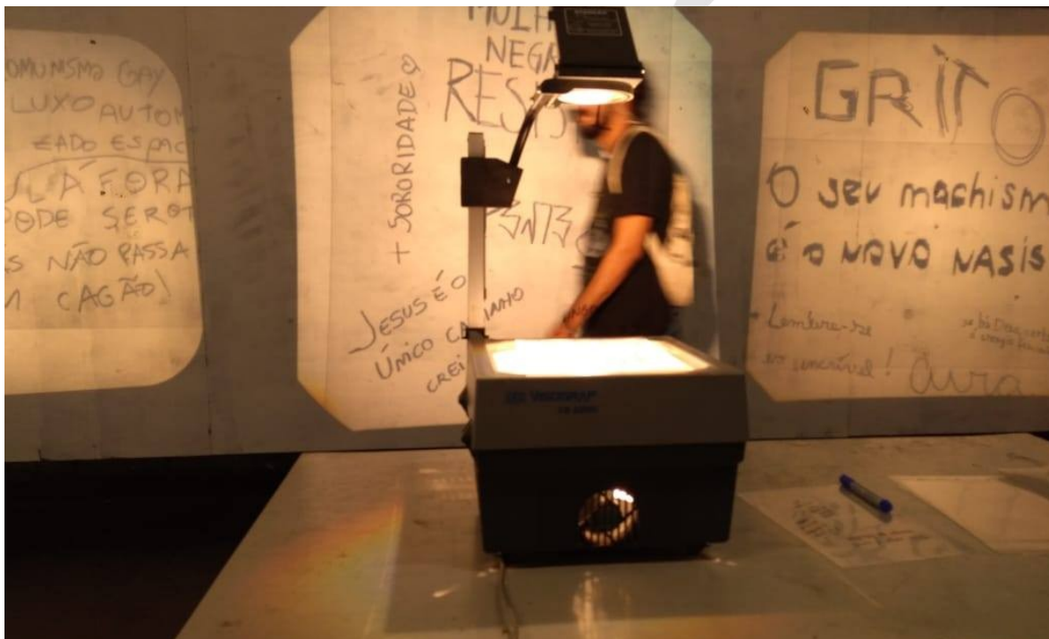
Fig. 3 – Registro da ação artística Fonte: Rayellen Alves Iniciativa Privada , Luana Andrade, 2018.

A metáfora para evocar o funcionamento de uma empresa surge a partir do momento em que a participação do público deixa de ser unicamente uma interação com a obra para se tornar a força que opera o próprio acontecimento artístico. Se ações de gerenciamento, produção e circulação de serviços caracterizam a atuação empresarial, é possível observar que, de forma semelhante, essas etapas se apresentam aqui em um outro território.