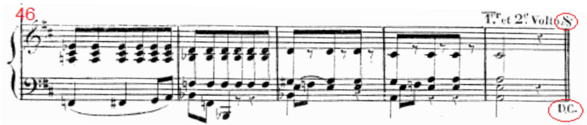
Figura 2: A canção Tristeza de José Amat, c.46-50, sinal Dal Segno e indicação de D.C. ( Da Capo ).