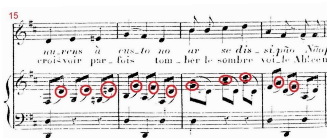
Figura 5: Tristeza , c.15-18, dobramento da linha vocal pelo piano, Em meio tempo à frente, precedido por notas que reforçam a condução tonal.

As frases da linha vocal em Tristeza têm início no c.9. São frases curtas, compostas prioritariamente por três compassos, com predominância dos valores de semínimas e colcheias. A linha do canto é silábica e se desenvolve por graus conjuntos, com a presença de pequenos saltos. Em relação ao piano, destacamos que, se por um lado há o dobramento da linha vocal, seu registro na partitura ocorre deslocado em meio tempo à frente da linha do canto, e pertencente a uma movimentação que inclui outras notas que apoiam a harmonia em questão, como podemos verificar na Figura 5, a seguir: