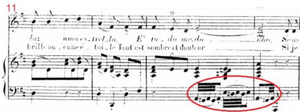
Figura 6: A canção Tristeza de José Amat, c.11-14, figuras contrapontísticas na escrita para o piano.