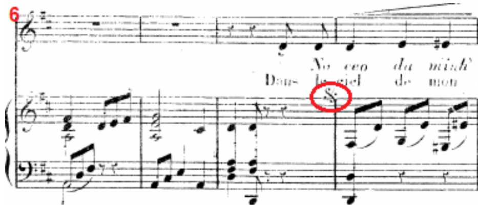
Figura 3: A canção Tristeza de José Amat, c.6-9, sinal Dal Segno indicando para onde se deve retornar.