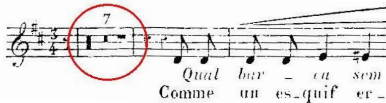
Figura 4: A canção Tristeza de José Amat, primeiros compassos da repetição com apenas a linha vocal.

Diante das questões inseridas na edição observada de Tristeza , única fonte da partitura de Tristeza , a solução que acreditamos ser mais indicada se configura no retorno ao sinal Dal Segno no c.9, e não a realização da introdução para a repetição, o que proporciona um melhor equilíbrio estrutural da performance da canção.