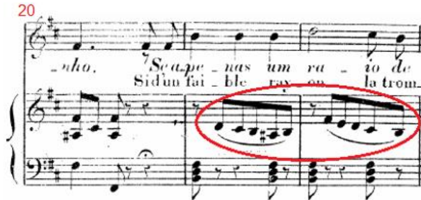
Figura 7: A canção Tristeza de José Amat, c.20-22, figuras contrapontísticas do piano.