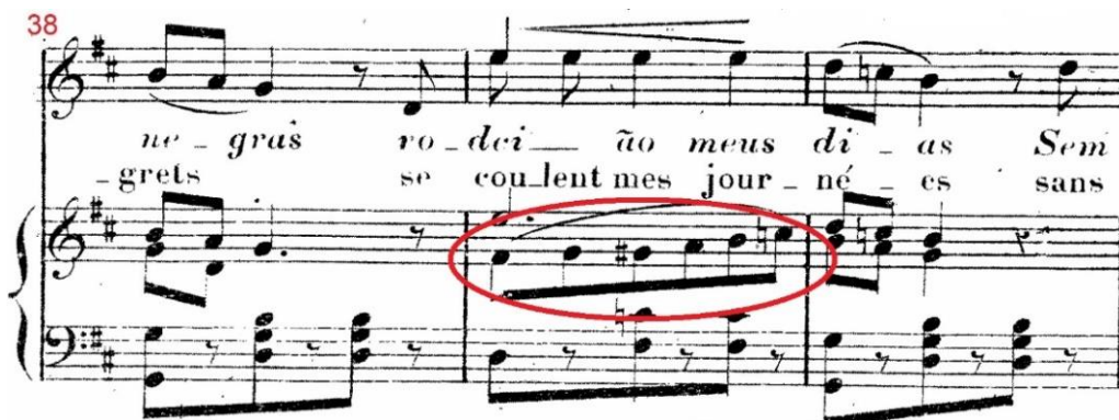
Figura 8: A canção Tristeza de José Amat, c.38-40, respectivamente: figuras contrapontísticas do piano.