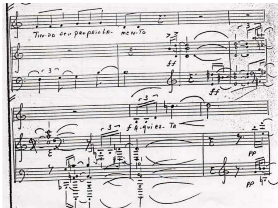
Figura 2: Dois retratos naturais de Cecília Meireles - Apresentação . Escrita mais dissonante e presença de clusters.