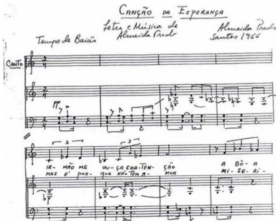
Figura 1: Canção da esperança (1966). Compassos iniciais: presença do ritmo do Baião.