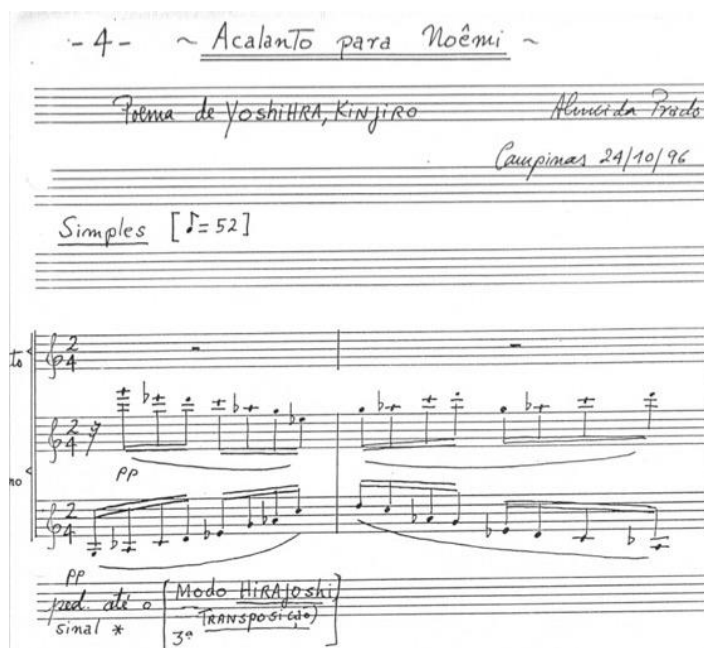
Figura 5: Acalanto para Noêmi (1996) obra dedicada a Soprano Adriana Kayama e sua família.

compositor, em anotações na partitura, menciona que tais escalas foram retiradas do livro Twentieth Century Harmony, Creative aspects and practice de Vincent Persichetti (1961).