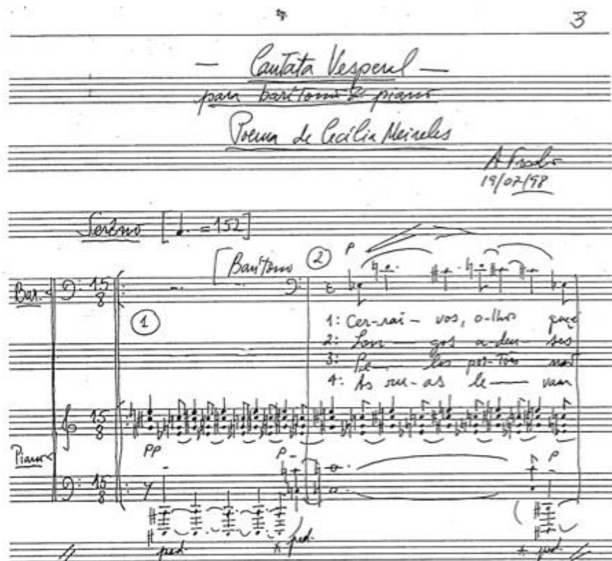
Figura 7: Cantata Vespertal composta para piano e barítono.

Os dados contidos na Tabela 2 foram retirados da segunda edição catálogo de obras de Almeida Prado da ABM, entretanto encontramos algumas inconsistências. A primeira é a respeito da Cantata Vespertal , que está catalogada como uma canção para soprano e piano, porém, esta foi composta para barítono e piano, como podemos observar na Figura 7, a seguir: