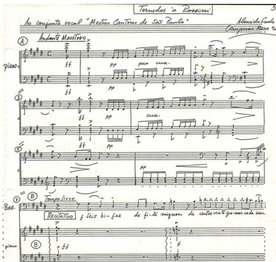
Figura 3: Tornados à Rossini (1992), obra composta com citações da abertura de Il Barbieri di Siviglia .

Destaca-se deste período o ciclo Jardim final ou breve olhares , escrito para tenor e piano. Segundo SANTOS (2004), a obra contém diversas das estratégias composicionais desenvolvidas por Almeida Prado ao longo de sua trajetória na composição das Cartas Celestes :