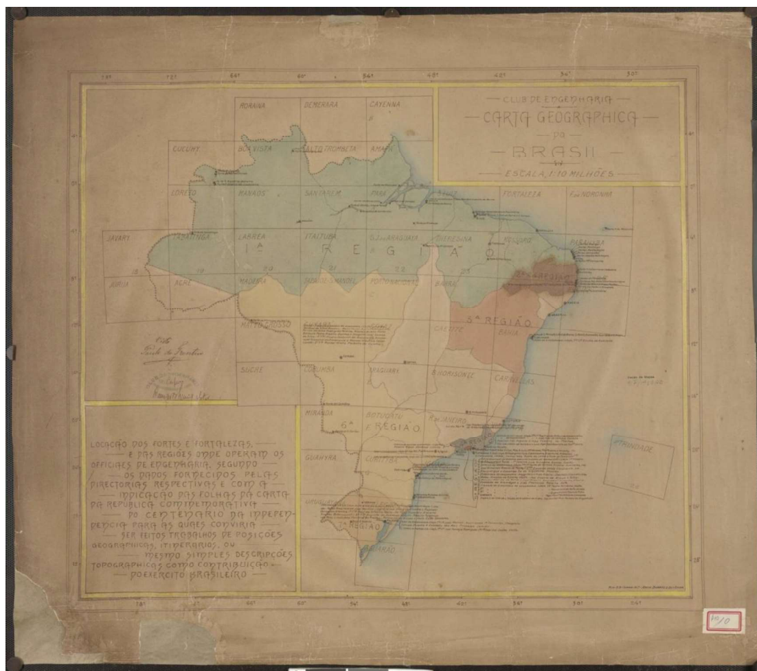
Imagem 2: Croquis para la construcción de la Carta Geográfica de Brasil. Rio de Janeiro, 1917.