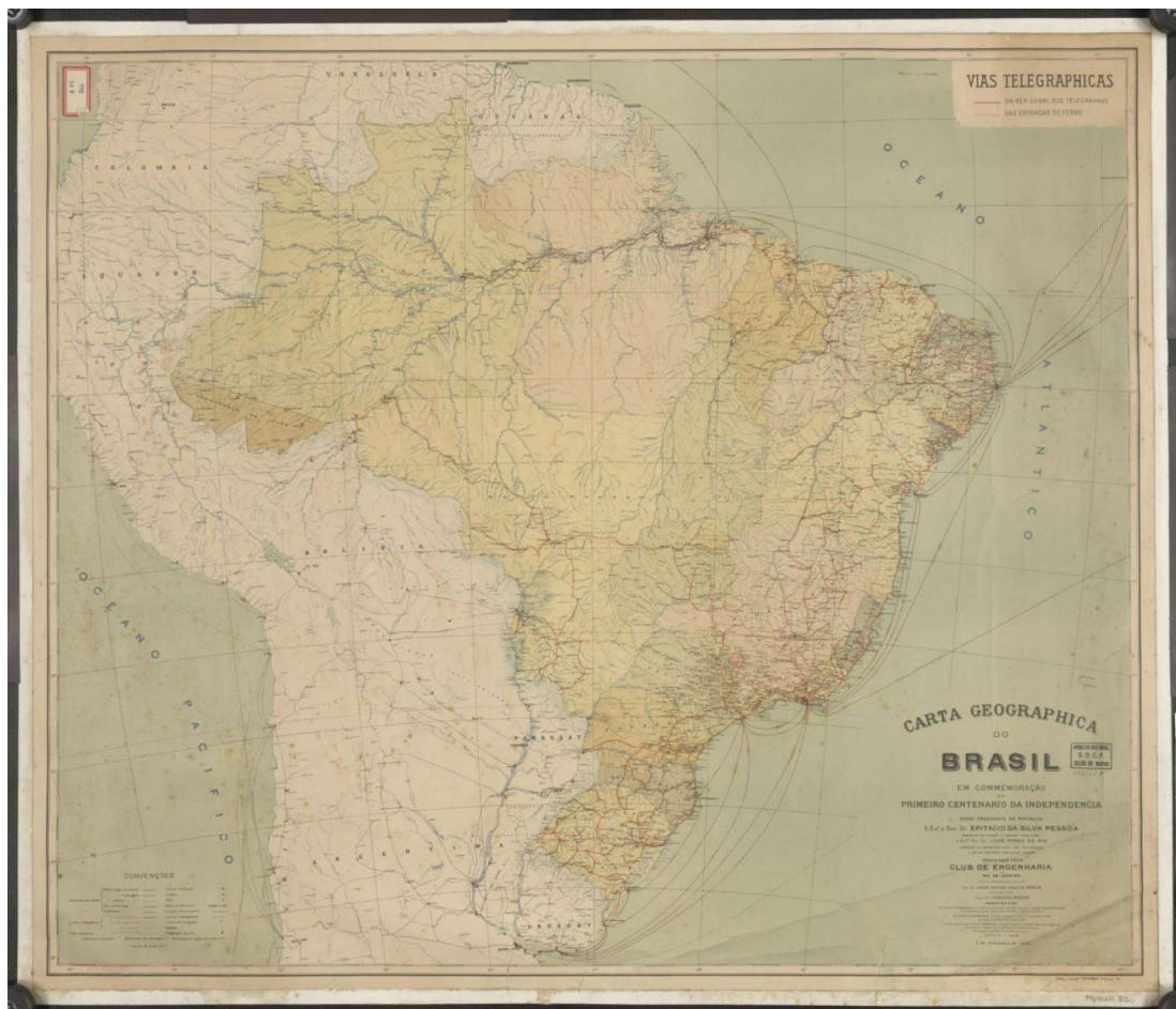
Imagem 1: Carta geográfica de Brasil em comemoração do primeiro Centenario de la Independencia. Rio de Janeiro, 1922.