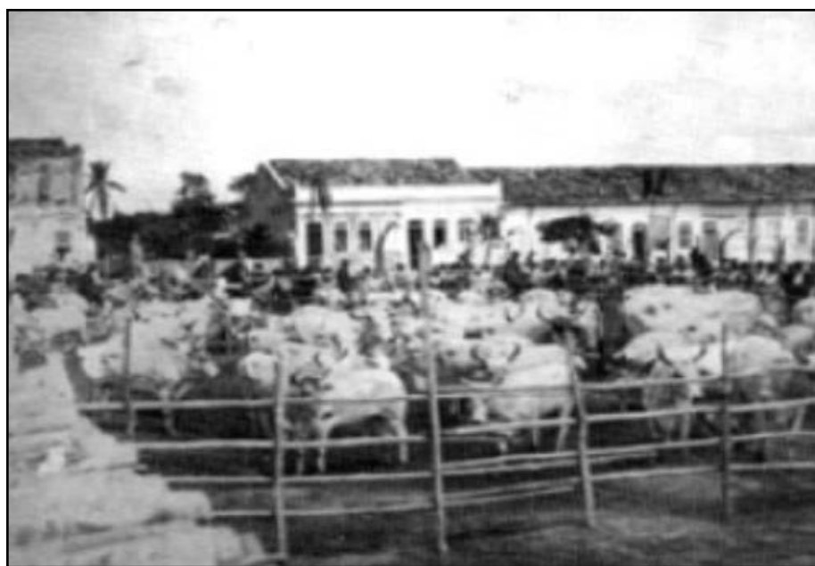
Ilustração 2: Feira do gado em Feira de Santana. 34

Diante dessa proibição, a atividade dos atravessadores se dava mais constantemente antes do gado ser Registrado na antiga Feira do Capoeame (principal registro e feira de gados desde o século XVIII e até meados do século XIX, já que existem documentos relativos ao funcionamento do registro na Feira do Capoeame até 1837) ou depois do registro ser transferido para a Vila de Feira de Santana em meados de 1840. 33