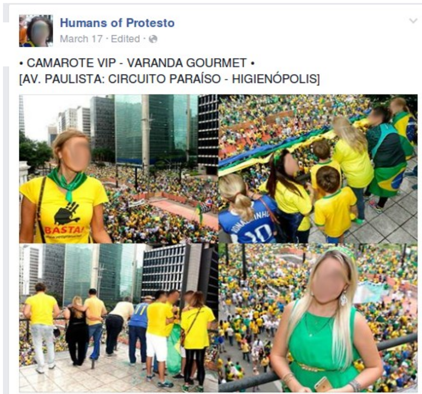
Figura 2: Lugar de qualidade.

para valorizar a posição privilegiada dos manifestantes.