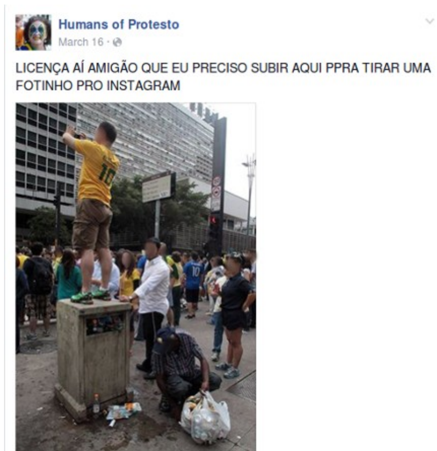
Figura 5: Lugar de pessoa.