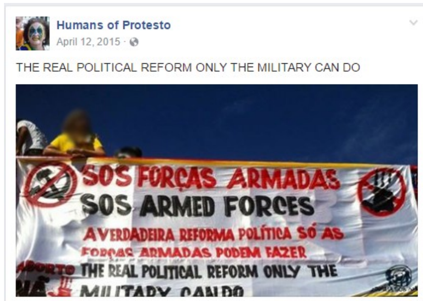
Figura 4: Lugar de essência.