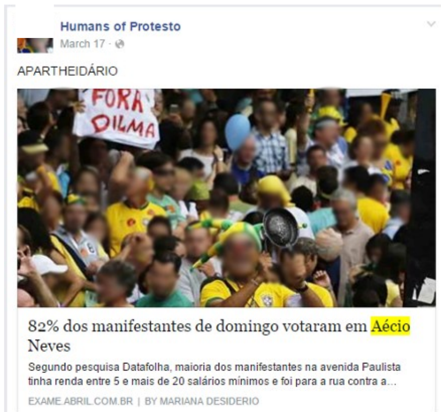
Figura 3: Lugar de ordem, a causa é mais importante que o efeito.

A referência se confirma em outra publicação que apresenta uma imagem repleta de manifestantes de pele branca, em que se lê: “foto do protesto em Salvador, cidade onde 80% da população é negra, a cidade com maior população negra do mundo fora da África.....” 9 .