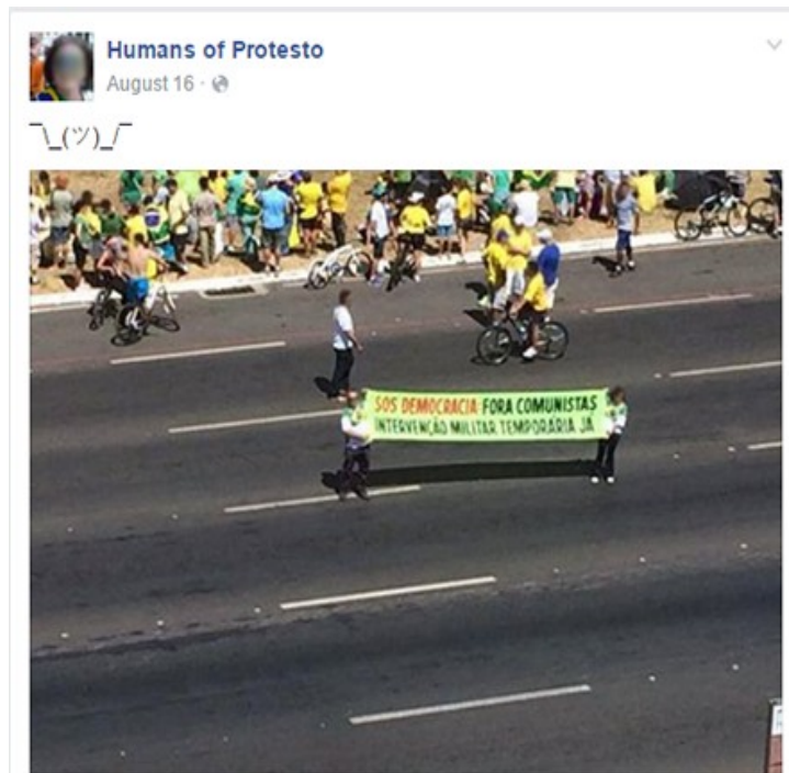
Figura 6: Retorsão.