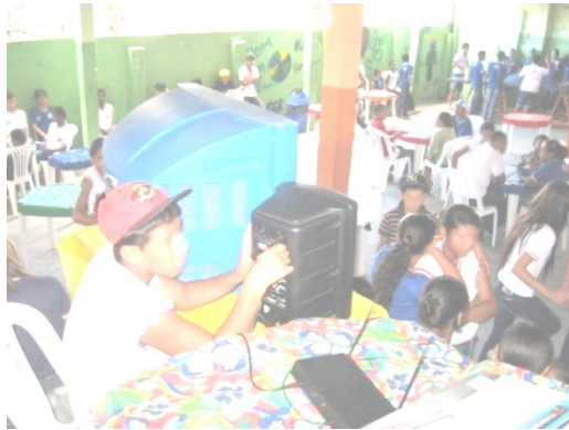
Figura 1: Estudantes transmitindo a rádio-pátio enquanto colegas escutam a programação.

pátio, outro destaque em apropriação das tecnologias na escola. A rádio funcionava quinzenalmente, na hora do intervalo e era roteirizada, dirigida e executada por uma equipe de estudantes coordenados pela professora-pesquisadora que participou da pesquisa (Figura 1). A rádio tem uma grande aceitação pelos estudantes que se concentram no pátio para ouvi-la e interagir com o programa transmitido. Há momento de recadinhos, músicas, avisos importantes da escola, dentre outras atrações.