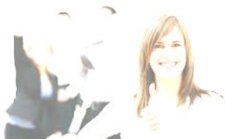
Figura 5: Como a professora se sente.

Como dito anteriormente, para compreendermos como a professora-pesquisadora avalia sua experiência, e ao mesmo tempo aprofunda sua reflexão sobre esse processo, utilizamos o recurso de uma colagem seguida por uma entrevista oral (Cf. ARAGÃO, 2008). Durante a entrevista, a professora-pesquisadora ratificou seu fluir coerente entre suas ações/emoções e a dos estudantes de forma positiva ao trazer as tecnologias e as redes sociais para o ensino e a aprendizagem de inglês. Ao questionarmos “Como você se sentiu na sala com o uso das redes sociais para o ensino/aprendizagem de língua estrangeira?” e convidá-la a refletir sobre os elementos, o contexto e as razões que a levaram a sentir-se assim, a professora selecionou a Figura 5: