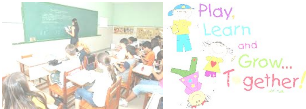
Figuras 6 e 7: Percepção da professora sobre alunos, na aula tradicional, e com as redes sociais.

Essa é a ideia transmitida pelas imagens escolhidas pela professora na colagem ao perguntarmos como ela representaria seus estudantes nas aulas onde predominam as metodologias tradicionais e outra nas aulas que abarcam também as redes sociais (Figuras 6 e 7, respectivamente).