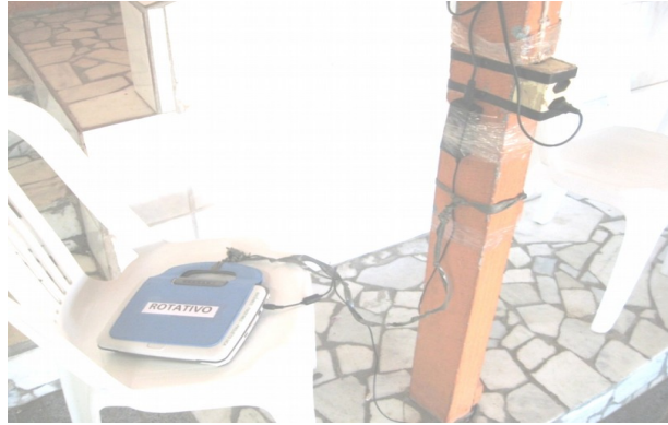
Figuras 3 e 4: Estudantes usam uquinhas e carregadores rotativos no pátio da escola.

A configuração de relações humanas embasada em relações cooperativas ajudou a superar os limites impostos pela infraestrutura bem como um discurso de descrença na possibilidade de ensinar inglês na escola pública e do uso de tecnologias digitais. A partir dessas bases de relações humanas, processos de transformação na convivência fluem na deriva ontogênica, o que Maturana (1998) denomina de aprendizagem. Com isso, se lida com a infraestrutura disponível de forma que ela se constitua como algo que possa subsidiar transformações e não limitações contingenciais a nossas práticas. Assim, embora se deseje e trabalhe para o fortalecimento das infraestruturas locais, estas não são distinguidas como impedimentos totalizadores à articulação de atividades digitais no ensino de inglês. Antes, guia-se por emoções que fundamentem ações coletivas para poder avançar e lidar com as limitações impostas pelas estruturas físicas que muitas escolas públicas ainda apresentam e atingir ações efetivas possíveis em cada contexto.