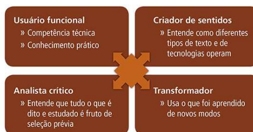
Diagrama proposto pelo Grupo de Nova Londres.

Na concepção dos Multiletramentos, propõe-se formar um usuário funcional, que tenha competência técnica, que entenda como diferentes tipos de texto e tecnologia operam, que tenha criticidade e que seja capaz de promover transformações (ROJO, 2012). O diagrama abaixo evidencia esses princípios.