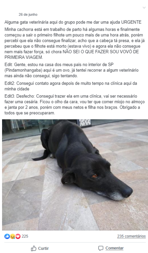
Figura 5. Postagem 3 e transcrição de sua tela-base.