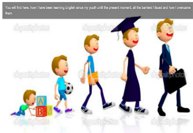
Figura 3. Imagem analisada por Gomes Junior (2016)