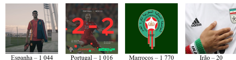
Figura 6. Publicações que os fãs mais expressaram raiva (😡)

Os dados mostram a predominância de fotografias, com o Irão sendo única exceção, por publicar um vídeo. Os fãs de Espanha e Portugal celebram o bom desempenho de suas equipas, pela vitória de 6 a 1 sobre a Argentina e a conquista do Campeonato Europeu de Futsal, ocorrido na Eslovênia. Os fãs de Marrocos celebram os feitos de um dos seus jogadores, Ayoub El Kaabi. Os adeptos do Irão expressam amor pelo vídeo que reúne a atuação dos jogadores numa partida difícil; o texto diz, em tradução livre: “Um clip assustador do corajoso jogo da seleção iraniana contra a Argentina. Compartilhe para mostrar solidariedade.” A Figura 6 apresenta as postagens que os fãs mais expressaram raiva.