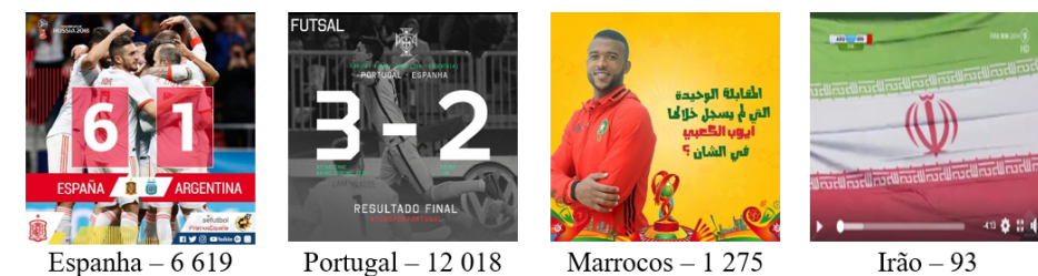
Figura 5. Publicações que os fãs mais expressaram amor (❤️)

Enquanto o futebol desperta a sensação de pertença, no caso do Mundial, fazer parte da saga de um povo também evoca a partilha de sentimentos variados (DORSEY, 2016). A Figura 5 mostra quais publicações fizeram com que os fãs das seleções mais expressassem amor, a partir da contagem do número de emojis desta categoria.