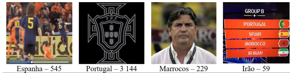
Figura 7. Publicações que os fãs mais expressaram tristeza (☹)