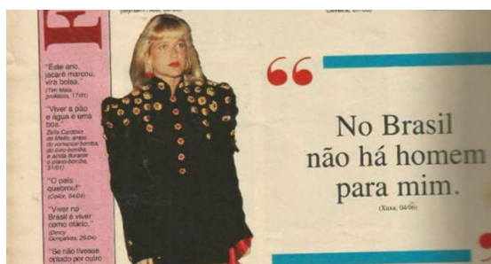
Figura 5. Trecho da seção Frases da Revista Contigo! .

O tweet da Figura 4 apresenta um trecho escrito — “Descartes depois que parou de pensar” —, acompanhado por uma imagem que contém uma foto da apresentadora, atriz e cantora Xuxa Meneghel, seguida da citação “não há mim”. A origem dessa imagem, que teve o trecho escrito modificado no tweet , está em uma edição de 1992 da revista Contigo! , a qual destacava, na seção Frases, a seguinte fala da artista: “No Brasil não há homem para mim”, Esse trecho da revista, assim como a reportagem retratada na Figura 2, viralizou na internet recentemente e gerou diversos memes. Na Figura 5, a seguir, mostramos a imagem original: