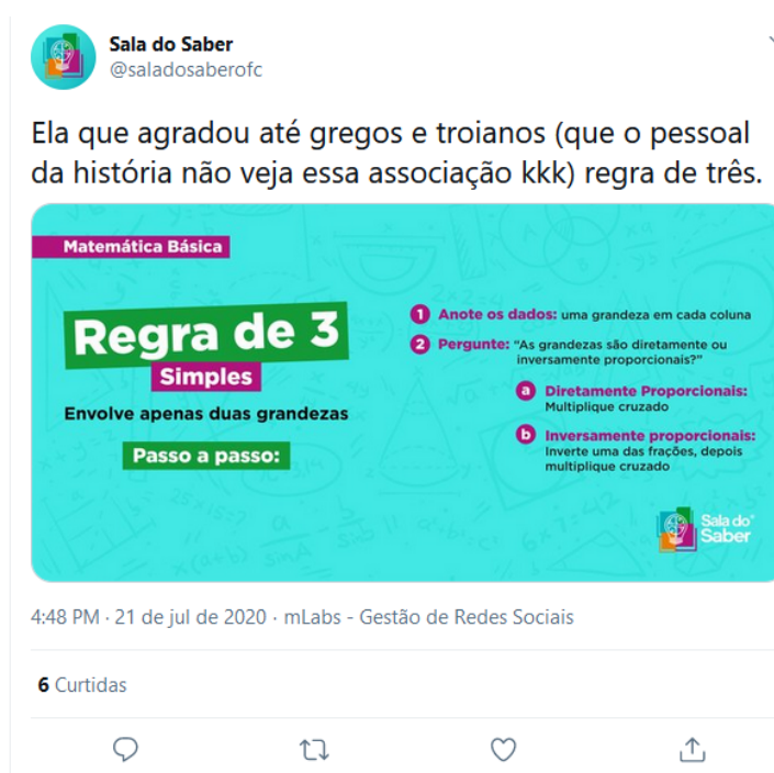
Figura 7. Tweet do perfil @saladosaberofc.

Para finalizar nossa análise, exibimos um tweet que pertence à área de Matemática, publicado, no dia 21 de julho de 2020, no perfil da plataforma de ensino online @saladosaberofc, que faz postagens relacionadas a conteúdos de diferentes áreas do conhecimento: