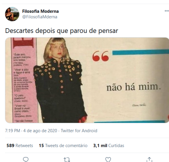
Figura 4. Tweet do perfil @FilosofiaMderna.

A seguir, dando prosseguimento à análise de dados, exibimos um tweet postado, no dia 4 de agosto de 2020, pelo perfil @FilosofiaMderna, cujos tweets são relacionados à área de Filosofia, que integra as Ciências Humanas.