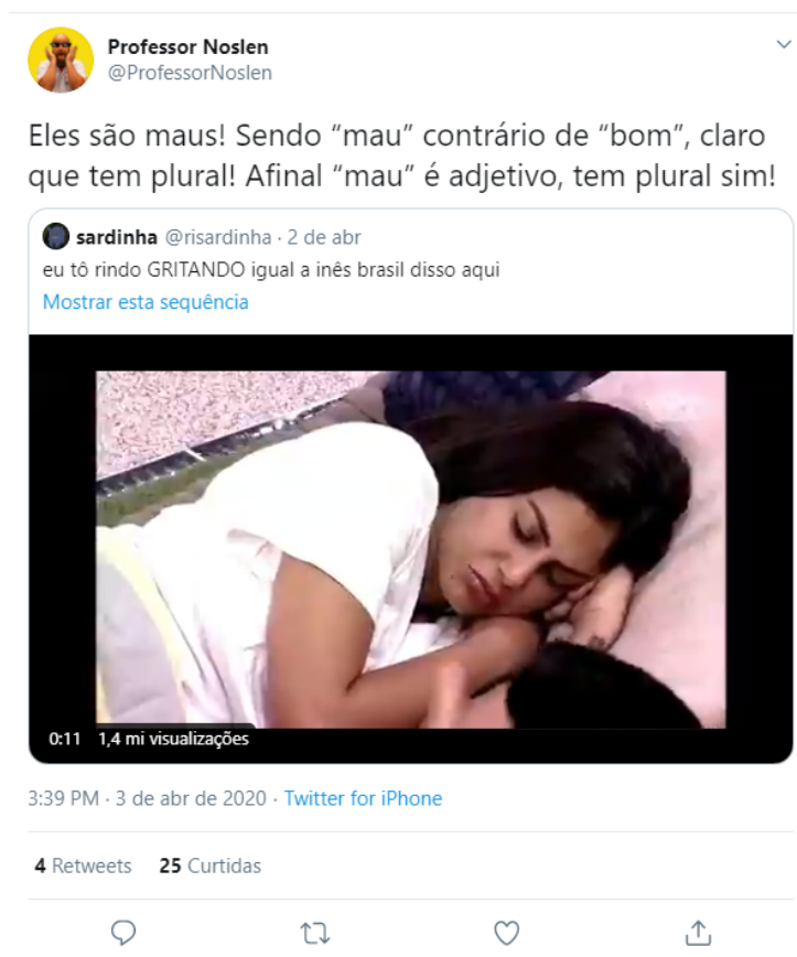
Figura 6. Tweet do perfil @ProfessorNoslen.

mundo no YouTube”, como aponta na biografia de seu perfil 16 .