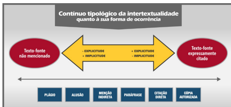
Figura 1. Contínuo tipológico da intertextualidade quanto à sua forma de ocorrência.

Koch, Bentes e Cavalcante (2012) propõem, ainda, que seja mais adequado considerar diferentes graus de explicitude, identificáveis por meio de marcas linguísticas. Fundamentado nisso, Mozdzenski (2013) elabora um contínuo tipológico relacionado à forma de ocorrência da intertextualidade, a fim de ampliar a concepção de graus de explicitude/implicitude, partindo, então, de um ponto de vista não dicotômico: