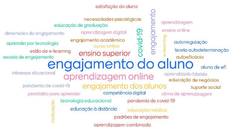
Figura 3. Nuvem de palavras dos títulos e keywords .

Iniciamos evidenciando os termos presentes nos títulos e keywords dos artigos. Para isso, criamos manualmente uma nuvem de palavras com o auxílio da plataforma Mentimeter. Observamos uma grande diversidade de vocábulos, o que se justifica pelo fato de os estudos estarem dialogando com outros conceitos além do engajamento do aluno/estudante. A Figura 3 demonstra os vocábulos que mais aparecem nos trabalhos investigados. Convém destacar que o termo que apresenta maior relevância conforme o resultado da figura é “engajamento do aluno”. Em ordem de frequência e destaque, seguem os demais termos: aprendizagem online , ensino superior, engajamento dos alunos, Covid-19 e engajamento.