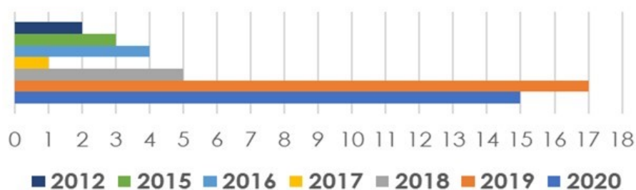
Figura 2. Quantidade de publicações por ano no portfólio selecionado.

A segunda análise realizada foi referente à quantidade de publicações por ano no portfólio (Figura 2).