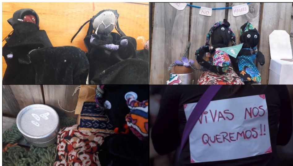
Figura 1. Narrativa Transmedia Gladys.

planteado en el cuento e incorporando personajes y símbolos presentes en él. Lo anterior permite constatar que las docentes identificaron los elementos del cuento cruciales para su interpretación literaria.