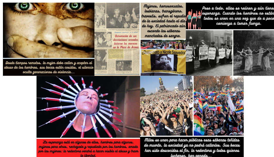
Figura 2. Narrativa Transmedia Amelia.