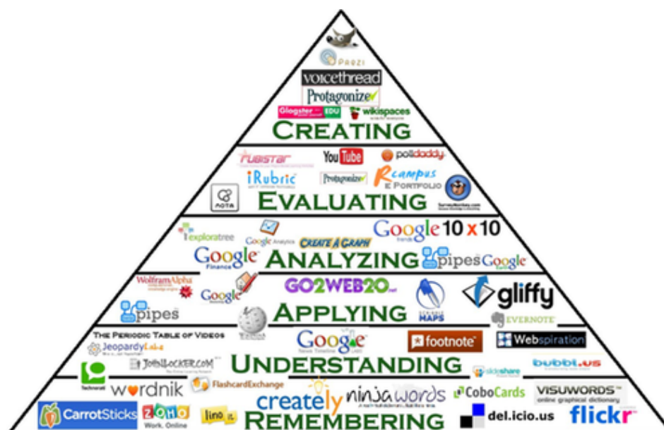
Figura 1. Pirámide de la Taxonomía Digital de Bloom.

En esta línea Penny (2015) propone la Pirámide de Taxonomía Digital de Bloom (ver Figura 1), que combina herramientas Web 2.0 con cada una de las categorías de Taxonomía de este autor, guiando al docente en el desarrollo de un modelo o proyecto pedagógico basado en el uso de las TIC y ayudando a los estudiantes a promover la adquisición de habilidades de pensamiento de orden superior.