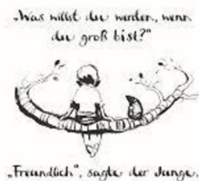
(d) Traducción al alemán.