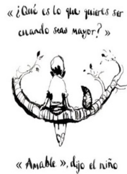
(b) Traducción al español.