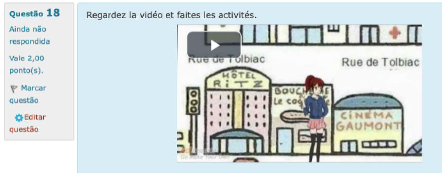
Figura 1. Seção Étude du genre textuel .