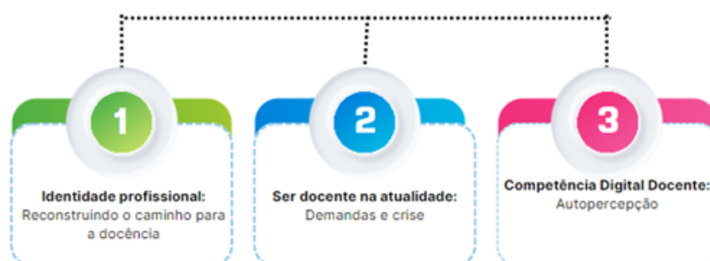
Figura 1. Dimensões da pesquisa.

As entrevistas se deram em três encontros, cada um pautado em uma das dimensões estipuladas previamente. Não foi estipulado tempo duração, tampouco questões fechadas, apenas um guia com os tópicos a serem tratados, considerados elementos das dimensões (Figura 2). Por ser uma entrevista em profundidade, a intenção era de uma fala livre por parte dos participantes e uma escuta intencionada por parte do pesquisador, com intervenção mínima, apenas para compreender as formas de sentir e