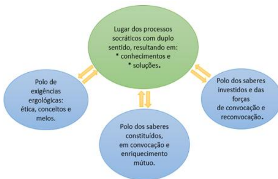
Figura 2 – Dispositivo dinâmico de três polos: esquema metodológico

Desse diálogo emerge, então, o terceiro polo, “a fim de fazer trabalhar os dois primeiros de modo cooperativo [humildade e rigor na referência ao saber], de maneira a produzir um saber inédito a propósito da atividade humana” (Schwartz; Durrive, 2008, p. 3). Vejamos na Figura 2: