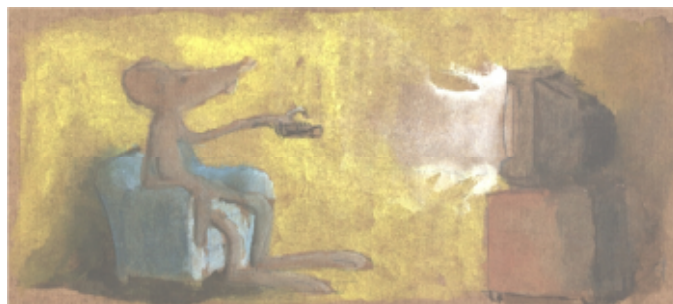
Ilustração Alessandro Lima