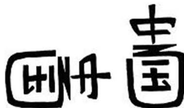
Figura 3: David Moser, China (Inglês/Chinês), heterograma de rotação 90 graus, s/data.

Como os ambigramas exercitam o seu potencial nas fronteiras da palavra e da imagem, torna-se possível até mesmo a criação de ambigramas bilíngües, onde o signo verbo/visual traz em si mesmo a sua própria tradução. Veja na figura 3 como a palavra China, girada em 90 graus no sentido anti-horário, mostra o ideograma chinês para a mesma palavra. Hofstadter chamou esse ambigrama de sinosigno .(2)