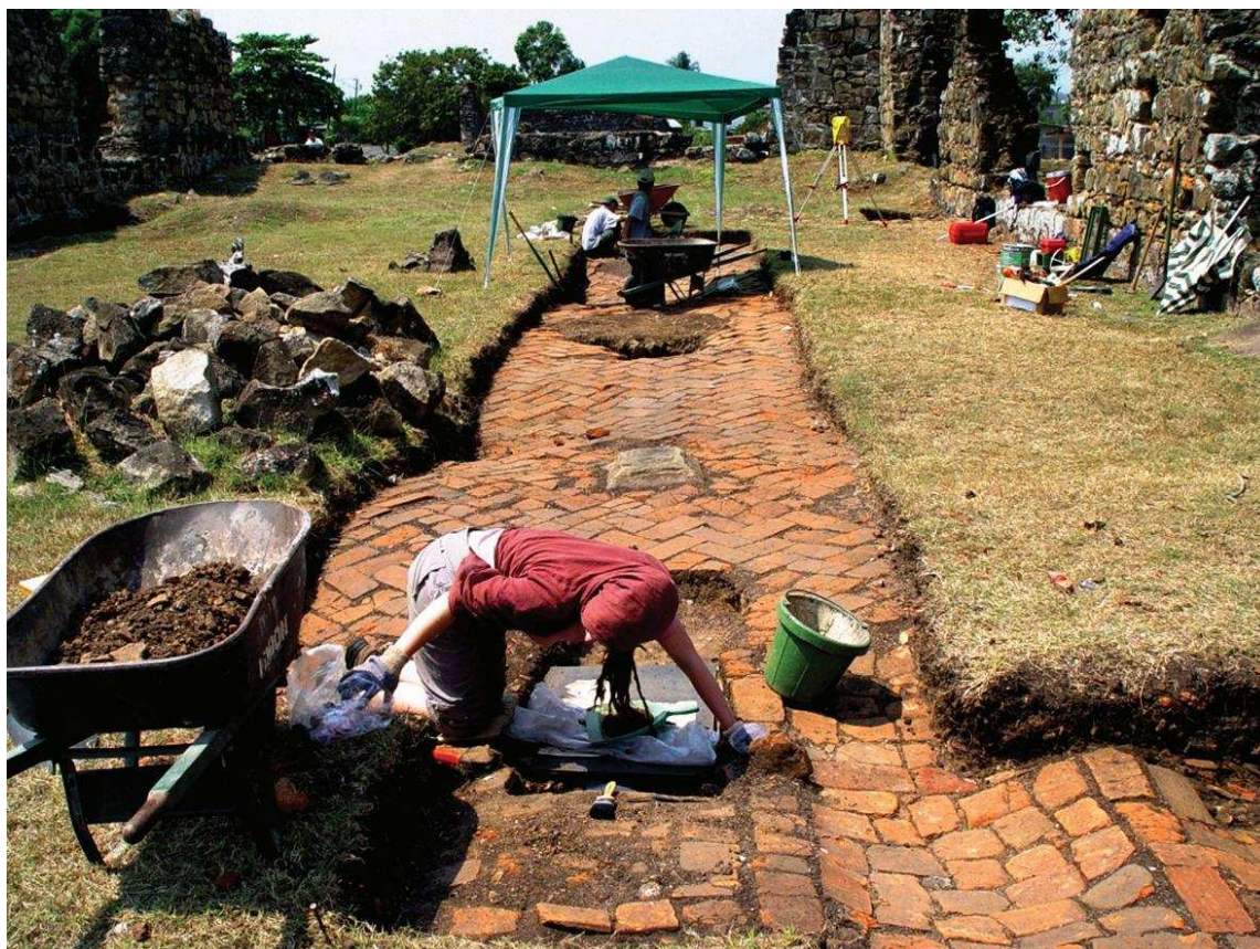
Figura 4. Excavaciones arqueológicas en las ruinas del Hospital San Juan de Dios.

4. Las excavaciones realizadas en la Plaza Mayor (PAPV 1996d, 1996e, 1998a) (figura 5), la prospección arqueológica asociada con la construcción del Centro de Visitantes (PAPV 2001b) y las excavaciones llevadas a cabo en el parque de Morelos permitieron desarrollar una línea de investigación sobre la ocupación prehispánica del sitio, identificando sus relaciones con el contexto arqueológico regional (Martín 2002b, 2002c, 2006, 2007; Pearson 2006; Martín y Sánchez 2008).