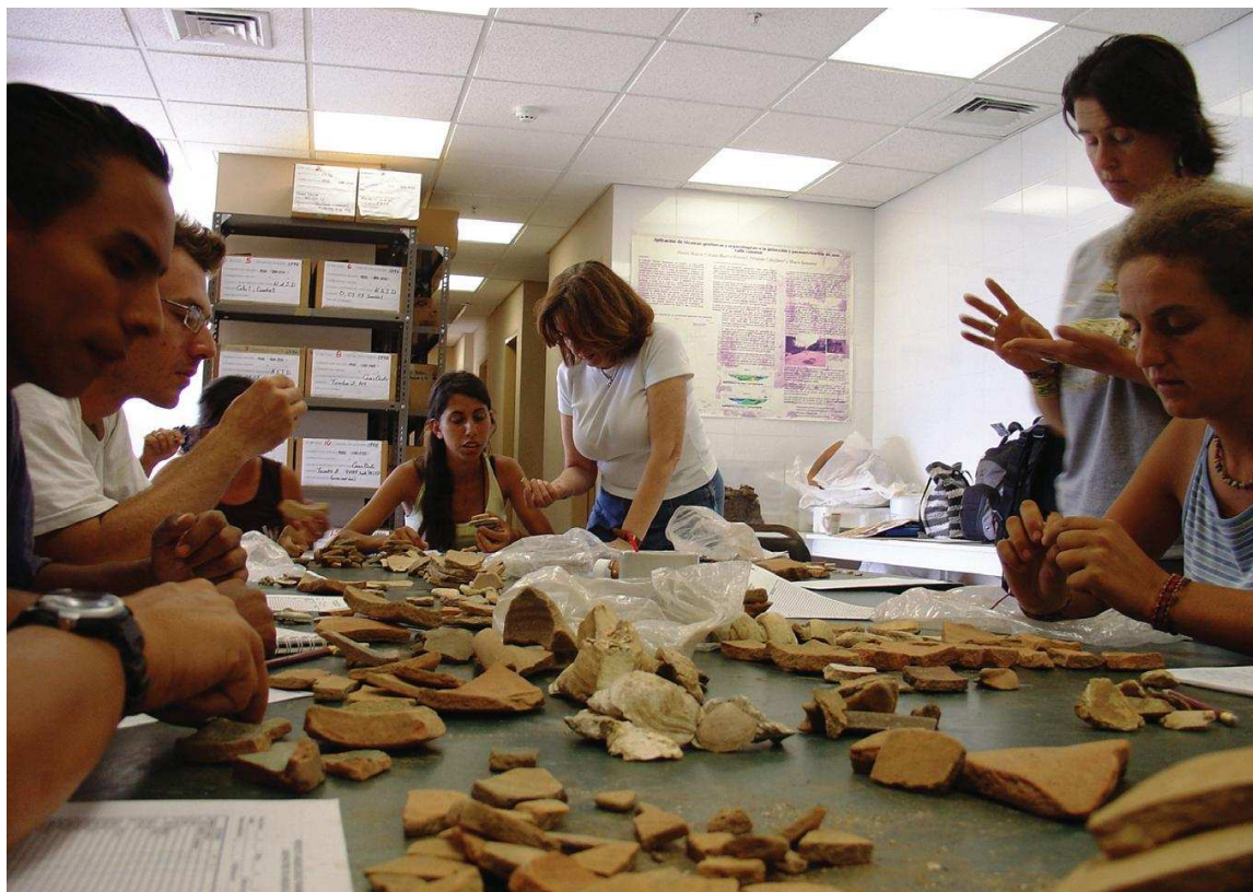
Figura 6. Laboratorio de Arqueología del Patronato Panamá Viejo.

con las Universidades de París VI, París IX, Reims y la Universidad de Panamá. La IV Escuela contó con un enfoque puramente arqueológico y desarrolló prospecciones geofísicas en diferentes áreas del Conjunto Monumental.