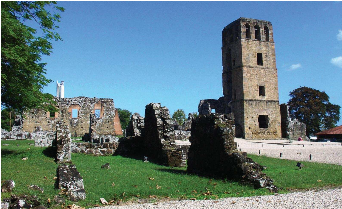
Figura 5. Torre de la Catedral y alrededores de la Plaza Mayor de Panamá Viejo.

5. En lo que respecta a paleoecología, desarrollamos un programa conjunto con el Instituto Smithsonian de Investigaciones Tropicales. El mismo se encuentra orientado a interpretar los cambios ambientales en la Bahía de Panamá y el impacto humano sobre los recursos del área desde una perspectiva de larga duración. En este marco, se llevaron a cabo análisis zooarqueológicos de contextos coloniales (Jiménez y Cooke 2001; Sanabria 2007), así como estudios especializados de moluscos marinos de los componentes prehispánico y colonial que constituyen el registro arqueológico del sitio (Martín y Rodríguez 2006).