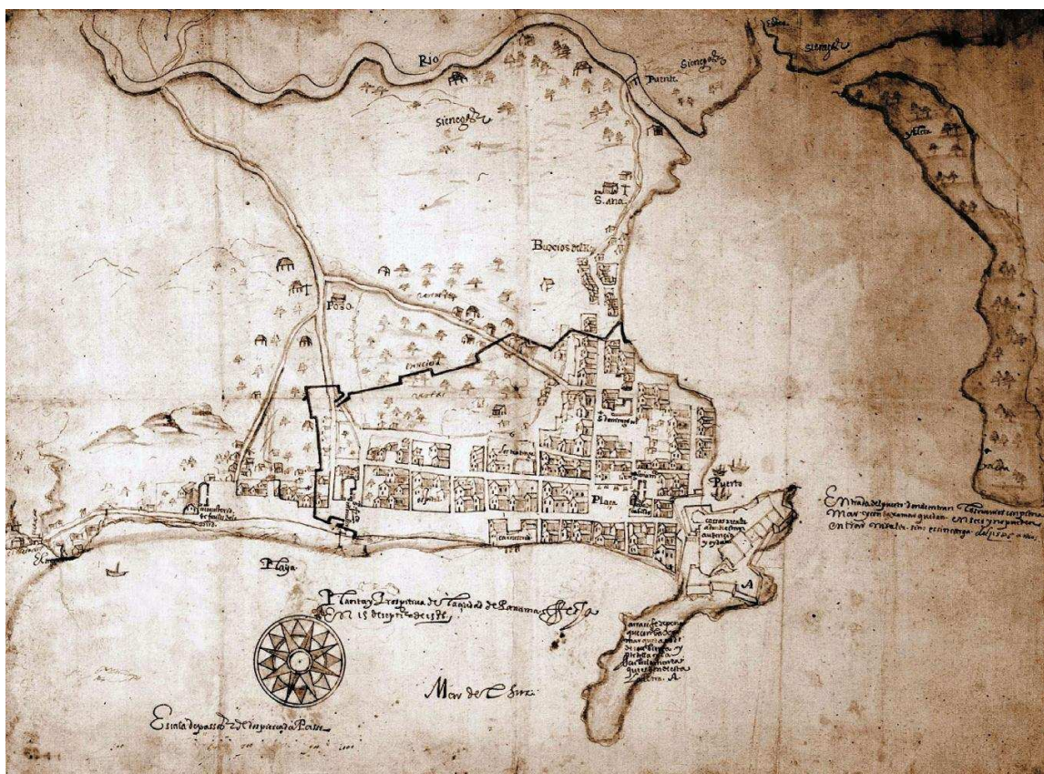
Figura 2. Plano de la ciudad de Panamá. Elaborado por Bautista Antonelli en 1586. Museo Naval de Madrid.