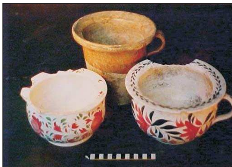
Fig 3. Materiales arqueológicos recuperados en excavaciones en la ciudad de Buenos Aires

Por su parte, Pedro Funari y Nanci Vieira de Oliveira (2005) detectaron diversas estructuras defensivas del siglo XVIII y XIX en Angra dos Reis. Esta región presentó un fuerte interés estratégico para Portugal y el estado brasileño, en tanto permitió conectar redes comerciales marítimas y terrestres. Como la historia de estas fortificaciones se entrelaza con discursos oficiales, Funari y Vieira de Oliveira planean abordar su estudio a partir de las prácticas cotidianas y la cultura material. Por otra parte, proponen analizar, preservar y socializar los hallazgos, aprovechando la interacción con las comunidades locales y los visitantes.