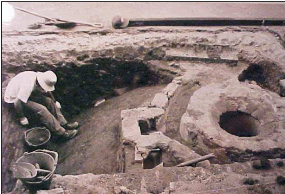
Fig . Excavaciones de rescate efectuadas en el centro de ciudad de Buenos Aires (2000)