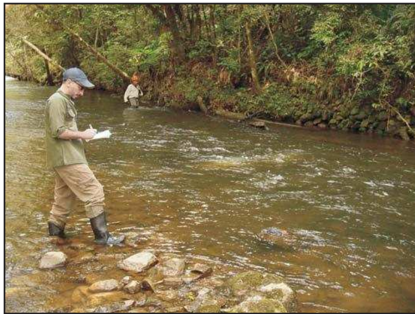
Fig 2. Arqueólogos registran una estructura para la extracción de oro del siglo XVIII (Estado de San Pablo-Brasil 2004)

Por otra parte, Bente Bittmann introdujo nuevos métodos para el estudio de casos en arqueología histórica e industrial en Chile. Desde esta perspectiva, analizó las plantas de nitrato que prosperaron en el desierto de Atacama desde finales del siglo XVII hasta la década de 1940 (Alcaide y Bittmann 1984).