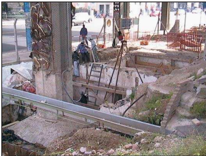
Fig 4. Imagen de la excavación del Centro Clandestino de Detención “Club-Aletico” (Buenos Aires, 2003)

Actualmente, diversos proyectos conducen tareas de excavación en centros clandestinos de detención. A partir de ello, pretenden construir una “memoria material” del genocidio, conocer el accionar de las estrategias represivas expresadas en la organización material y espacial de estos lugares (Bozzuto et al. 2004; Zarankin y Niro 2006), y analizar las pequeñas situaciones de resistencia generadas por los detenidos (López Mazz 2006; Navarrete y López 2006). Otros trabajos analizan el rol desempeñado por la cultura material y las prácticas corporales como parte de los intentos de los grupos militares por categorizar, estigmatizar y borrar las identidades de sus opositores (Salerno 2006b, 2006c).